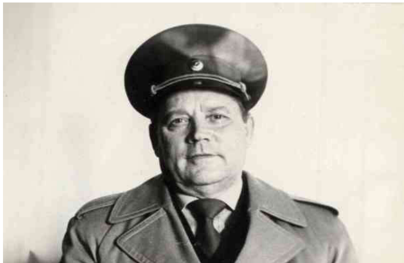
М. П. Чайковський

Перші заходи по створенню лабораторії “Голицький біостаціонар” розпочалися ще близько 30 років тому, коли відомий в Україні еколог і знавець регіональної флори і фауни М.П.Чайков-